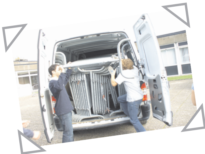
...Faire du barriérage