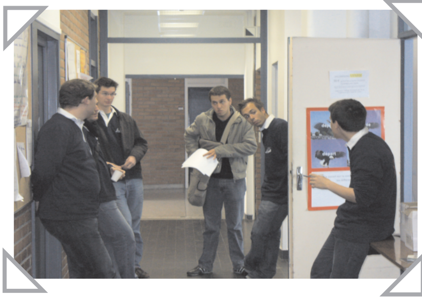
Le montage Forum, c'est une équipe de volontaires motivés pour...